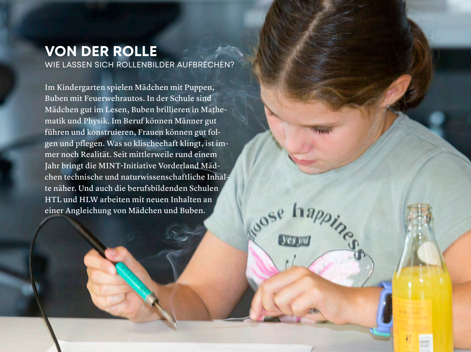
MINT-Teilnehmerin beim Löten.

Im Kindergarten spielen Mädchen mit Puppen, Buben mit Feuerwehrautos. In der Schule sind Mädchen gut im Lesen, Buben brillieren in Mathematik und Physik. Im Beruf können Männer gut führen und konstruieren, Frauen können gut folgen und pflegen. Was so klischeehaft klingt, ist immer noch Realität. Seit mittlerweile rund einem Jahr bringt die MINT-Initiative Vorderland Mädchen technische und naturwissenschaftliche Inhalte näher. Und auch die berufsbildenden Schulen HTL und HLW arbeiten mit neuen Inhalten an einer Angleichung von Mädchen und Buben.