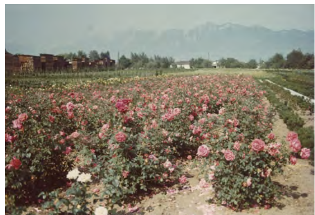
Rosenzucht im Bifang, ab 1978.