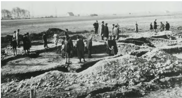
Zahlreiche Schaulustige kamen zu den ersten Ausgrabungen im Sommer 1954.

Bereits in den Jahren 1927 und 1937 wurden einzelne Personen, darunter auch der ehemalige Rankweiler Bürgermeister Serafin Reich, auf römische Spuren im Weitried aufmerksam. Dennoch führten erst Planierungsarbeiten im Zuge des Umlegungsverfahrens in Brederis-Weitried im Herbst 1953 zur Wiederentdeckung zweier Gebäude des Gutshofs.