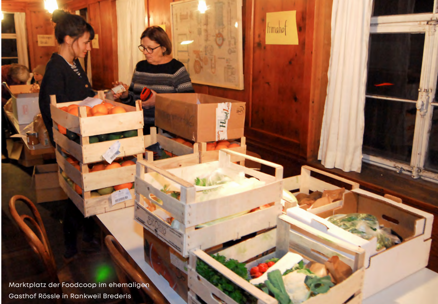
Marktplatz der Foodcoop im ehemaligen Gasthof Rössle in Rankweil Brederis