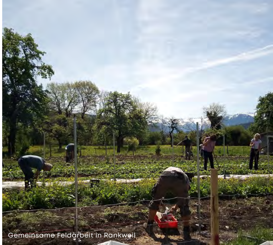
Gemeinsame Feldarbeit in Rankweil

Anmeldung und weitere Informationen unter info@kostbar.fcoop.at oder www.kostbar.fcoop.at .